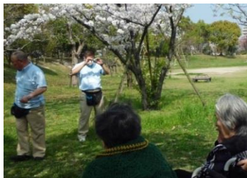
▲ 4月の行事「花見」にて